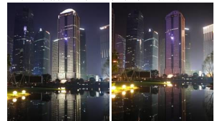
（熄灯前后的恒生银行大厦）