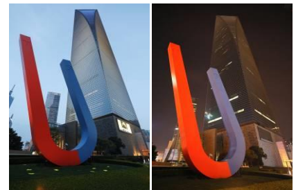
（熄灯前后的上海环球金融中心）