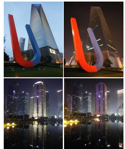
（熄灯前后的上海金融中心&恒生银行大厦）