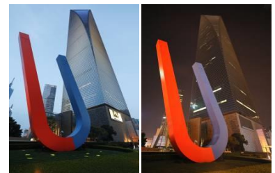
（熄灯前后的上海环球金融中心）